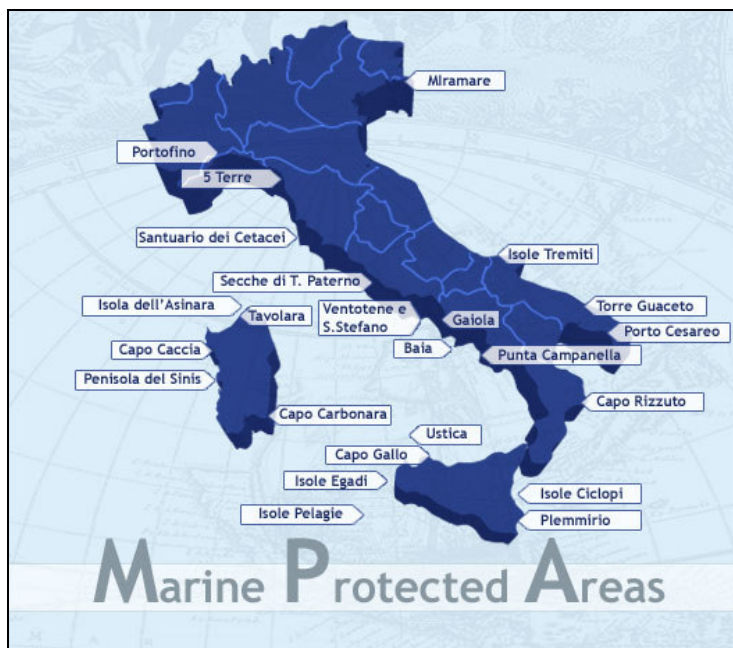
Carte 2 : Localisation des AMP italiennes

Les outils pour la sélection des sites à protéger se sont également développés au cours de cette période. Depuis le milieu des années 1990, le service de la protection du milieu marin du Ministère de l'environnement a mis en place un programme de suivi environnemental du milieu (en mer et sur les côtes) dans le but de renforcer la connaissance et d'améliorer la conservation des écosystèmes en identifiant les causes de leur altération. Une base de données globale a été élaborée regroupant les résultats de ces activités de suivi (Si.Di.Mar). Parallèlement à cette base de données, la Société nationale de biologie marine a réalisé un inventaire relativement complet pour l'ensemble des côtes italiennes selon une typologie propre au milieu marin, un peu à l'image de nos « ZNIEFF-mer ». L'ensemble de ces données constitue un outil précieux d'aide à la sélection des zones à protéger dans le cadre de la stratégie nationale.